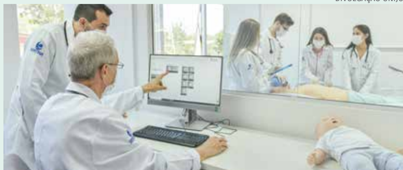
Laboratório de Simulação e Habilidades da Unijuí já está sendo utilizado

O curso de Medicina da Unijuí possui uma carga horária maior do que a mínima exigida pelas Diretrizes Curriculares Nacionais, chegando a 9 mil horas-aula. Segundo Brust, esse diferencial é benéfico, tanto para a formação específica do aluno, quanto para a saúde coletiva, pois os estudantes já no quarto semestre desenvolvem atividades na rede hospitalar, iniciando o contato prático na área: