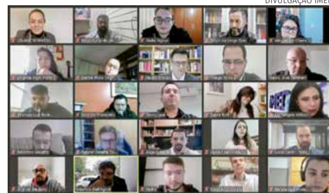
Atividades práticas do curso de veterinária da IMED ganham modelo distanciado ao mesmo tempo que demais cursos seguem com aulas no Zoom

Buscando maior flexibilidade entre seus cursos, a Universidade Regional Integrada do Alto Uruguai e das Missões (URI) vêm discutindo a alguns anos a possibilidade de tecnologias de ensino serem um forte aliado no ensino híbrido de estudantes de todo o Estado. Fundada em 1992 e atualmente com seis campi pelo Estado, a universidade se reinventou em 2019 implantando 18 cursos à distância, sendo dois híbridos e 16 cursos EAD.