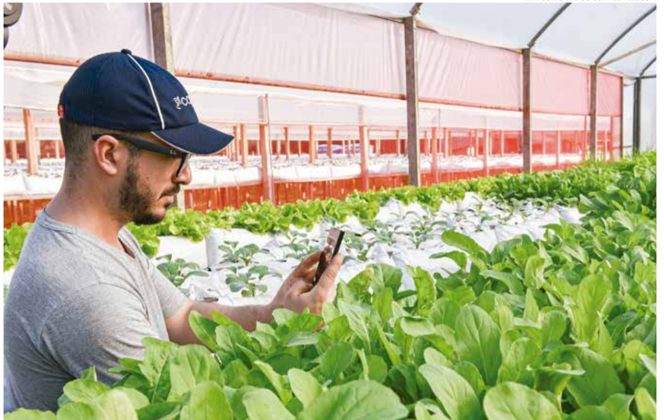
BANCO DE DADOS COPREL TELECOM

Algumas cidades, como Ibirubá, Passo Fundo e Quinze de Novembro, já trabalham a utilização de fibra óptica que permite uma conexão ainda mais rápida. A Coprel atende mais de 30 cidades nas Regiões Norte e Noroeste do estado.